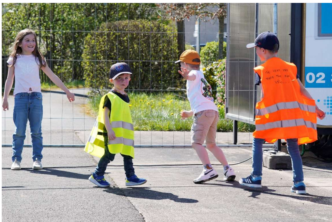
« Je veux une piste pour mon vélo »

Ma position : Vu que le CD57 a détruit la partie macadamisée pour effectuer ses travaux, il lui appartient de la remettre en état ; par ailleurs, vu que la CCSMS a reçu des subventions pour la piste cyclable Euro n°5 (Euroveloroute 5), que ces deux collectivités s'accordent vite et réalisent les travaux.